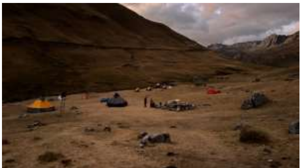
Die ersten Ausblicke genießen